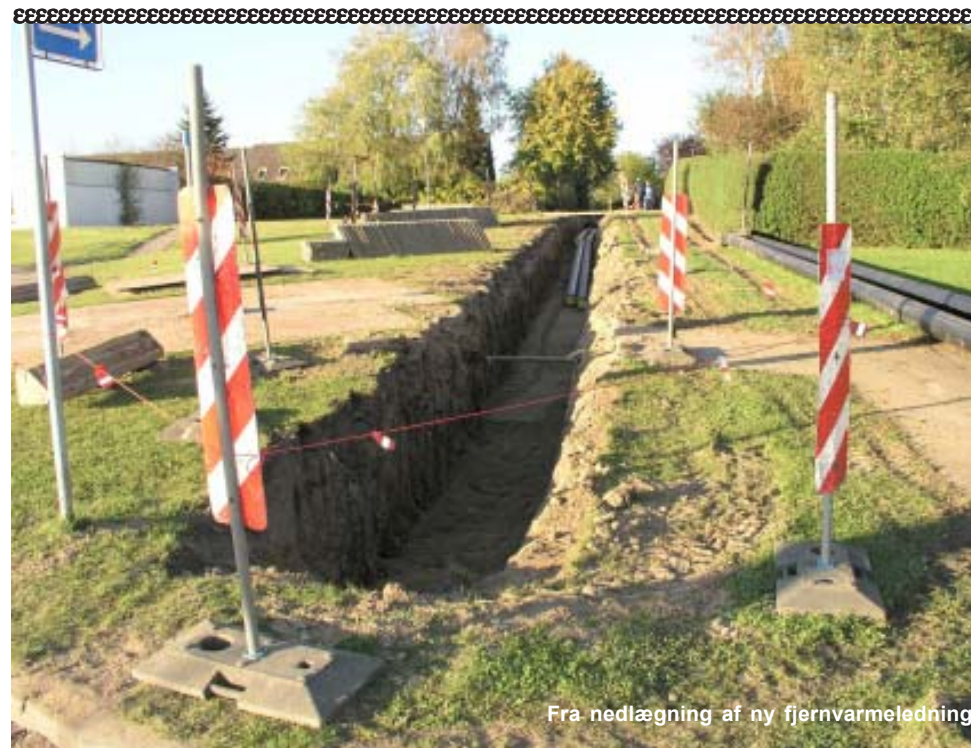
Fra nedlægning af ny fjernvarmeledning