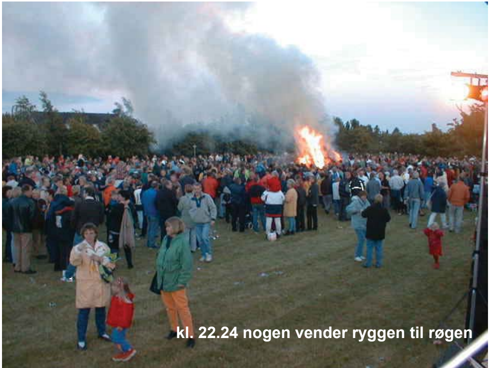
kl. 22.24 nogen vender ryggen til røgen

fænomener, er der vel ikke noget, der tryllebinder som lyset. Selv om man ikke har tiltro til de gamles forestillinger om naturkræfterne i midsommernatten, så kan man vel mærke magi'en i sommernattens lys og i lyset fra Sankt Hans bålet. I lyset, solen og ilden findes en kraft, som vi alle er afhængige af. I nat, ved solhverv vender året. Om et halvt år til jul vender det igen. Ved begge årets vendepunkter tænder vi lys. Julelys og Sankt Hansbål. Begge tændes for at fejre lyset og holde os mørket fra livet, For over alt hvor der tændes lys, kastes der også skygger. Jo stærkere ilden buer, des mørkere falder dens skygger omkring os. I mørket bor det, vi frygter. Det fremmede. Det vi ikke kender, men gør os forestillinger om. Det vi ikke tør se i øjnene, men alligevel trues af. Vi forsøger at holde mørket og dens ukendte ansigter fra livet, Vi er ikke overtroiske, men symbolkraften i at tænde lys. Når vi står sammen om det lysende, varme og luende bål og mærker kulden i ryggen, så er det et ganske godt billede på, hvad vi også som moderne mennesker ønsker. At stå sammen om lyset og holde os mørket fra livet.