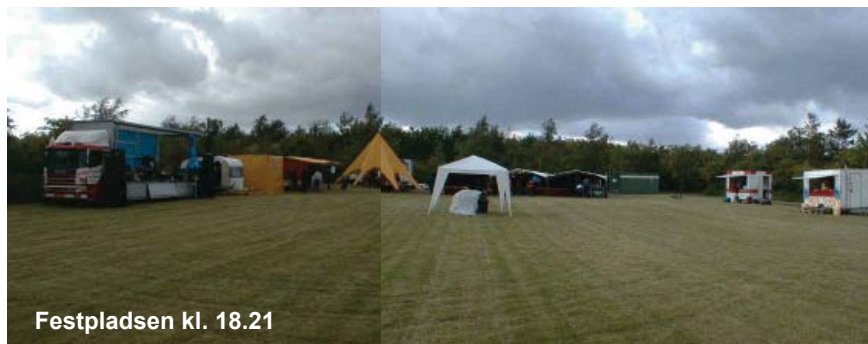
Festpladsen kl. 18.21