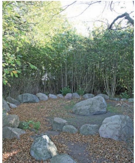
Oldermandspladsen er ryddet/klippet og klar til at bruge – God fornøjelse