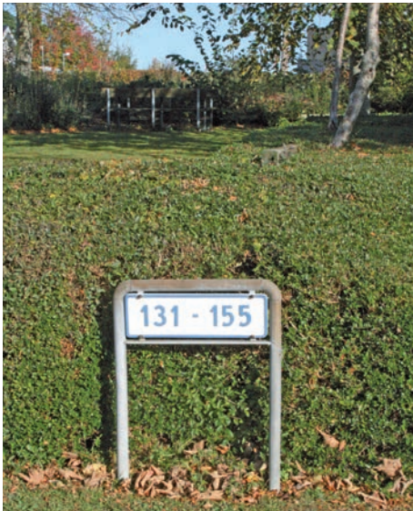
Alle skilte med vejnr. er under renovering – rengjorte og nymalede