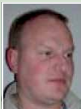
Steen Boye Jegstrupvænget 159 Ansvarsområde 2 Grønne områder og veje