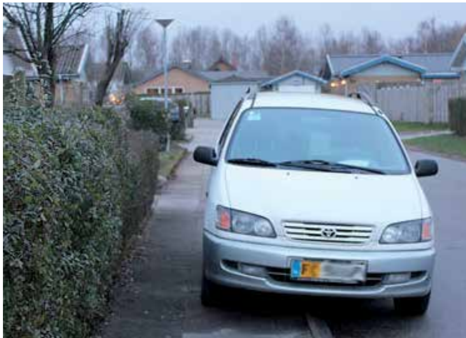
Denne bil er parkeret hensynsløst og ulovligt. Fx kan en barnevogn ikke komme forbi på fortovet og fliserne bliver trykket og evt. knækker.