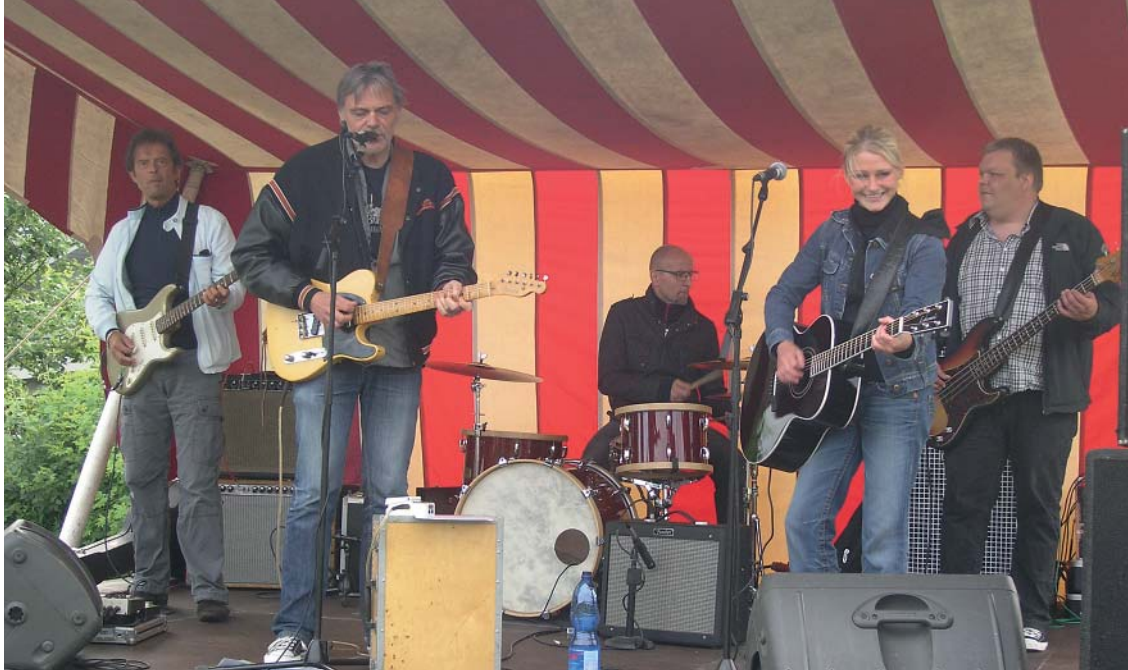
Fra Skt. Hans-festen 2011.

angående parkering m.m. i området. En parkeringssag har dog været meget tidskrævende, da jeg skulle grave dybt for at finde diverse tinglysninger.