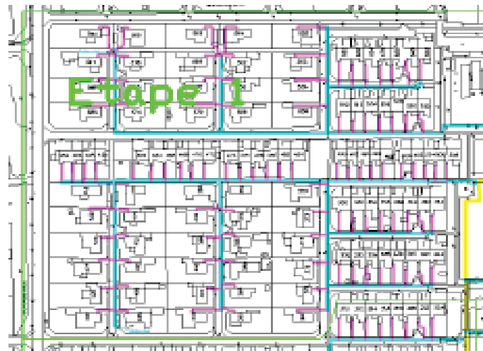
Etape 1. Skovgårdsvænget 330 til 508

Når der reetableres asfalt og opkørsler efter opgravning er det en midlertidig asfalt der bliver lagt på, idet Århus kommune, for at undgå sætningsskader i de opfyldte udgravede områder, kræver at det endelige slidlag først lægges efter en 2 årig periode, Efter denne periode, er det Tranbjerg Varmeværk der står for pålægningen af det endelige slidlag og genetablering af kantstenoverkørsler.